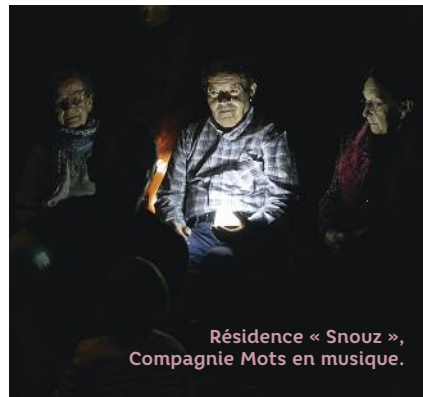
Résidence « Snouz », Compagnie Mots en musique.